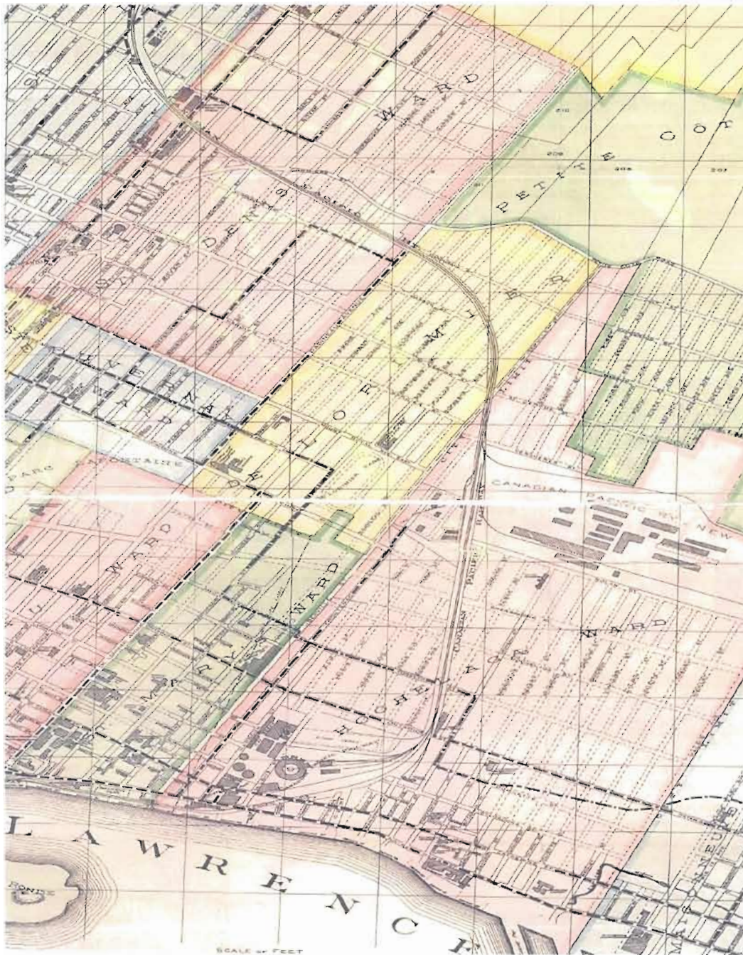
Figure 2.1 L'Est de Montréal vers 1904